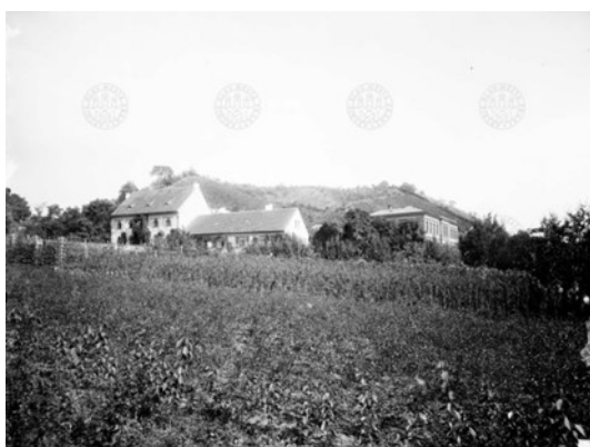
Obr. 2. Pomologický ústav, č. p. 91, usedlost Popelářka v Troji 14

Prof. Lambl neměl v úmyslu věnovat se politické kariéře, ale v roce 1861 byl navržen a zvolen za poslance venkovských obcí okresu rychnovského a kosteleckého do sněmu Království českého. Tento mandát přijal z důvodů, aby se postaral o zákonnou úpravu hospodářského školství v Čechách. Ještě v témže roce podal zemskému sněmu, podporován knížaty J. Lobkowiczem a K. Schwarzenbergem, návrh na zřízení speciálních škol pro polní hospodářství a hospodářský průmysl.